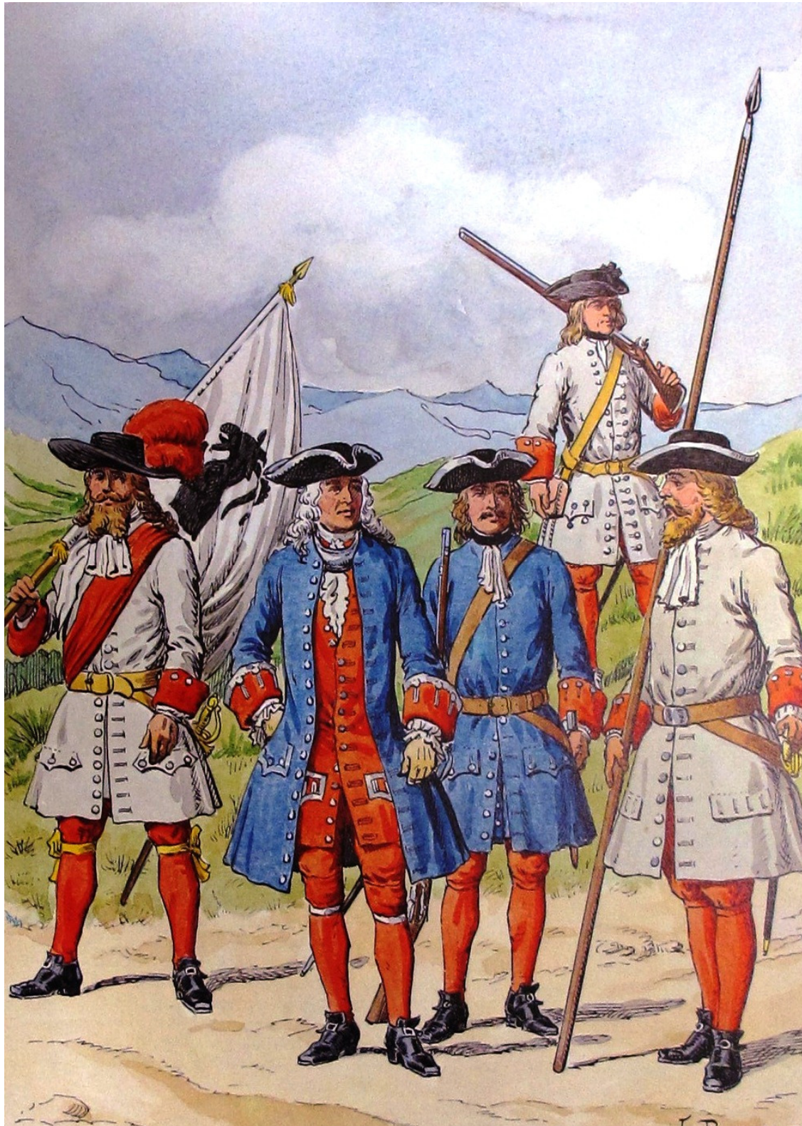
Von links nach rechts: Ein Fähnrich, zwei Offizier, ein Füsilier, ein Spiesser