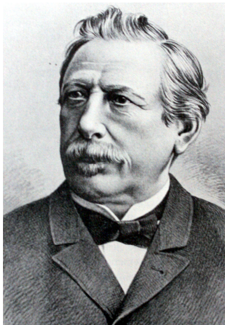
Bundesrat Karl Schenk (1823-1895)

Schenk studierte an der Universität Bern Theologie und nach der Beteiligung als Feldprediger am Sonderbundskrieg wurde er Pfarrer in Schüpfen. Nun begann aber auch eine intensive Tätigkeit als Journalist der Berner Zeitung. 1855 wählte man ihn in den Regierungsrat, wo er eines der grössten Probleme seiner Zeit – die Armennot – in der Armendirektion zu lösen hatte. Hier konnte sich Carl Schenk die Lorbeeren verdienen, die ihn später in der ganzen Schweiz bekannt gemacht haben.